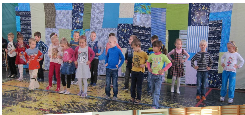
Vystúpenie - Október mesiac úcty k starším