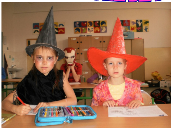
Halloween v II.A