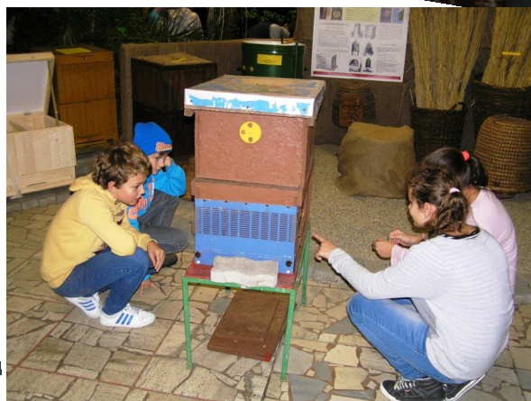
V Botanickej záhrade v Košiciach