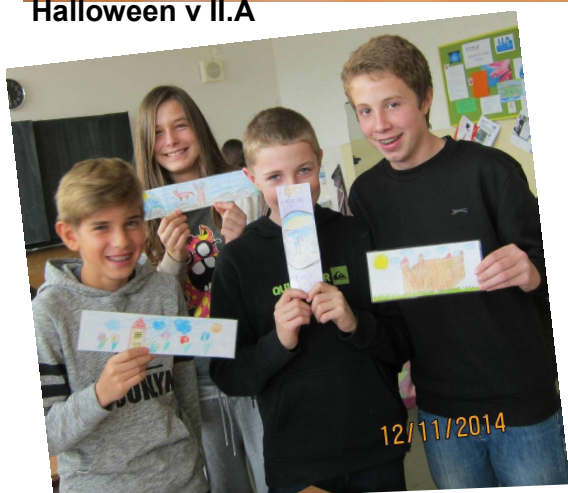
Záložka do knihy spája školy