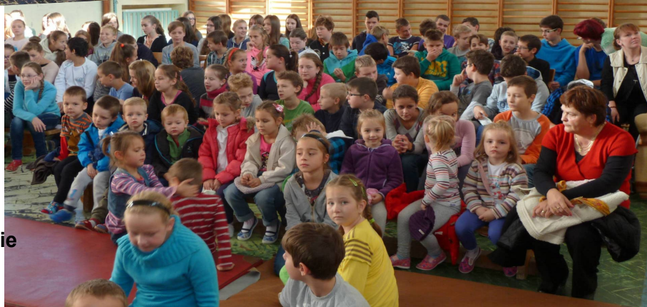
Divadelné predstavenie Snehulienka