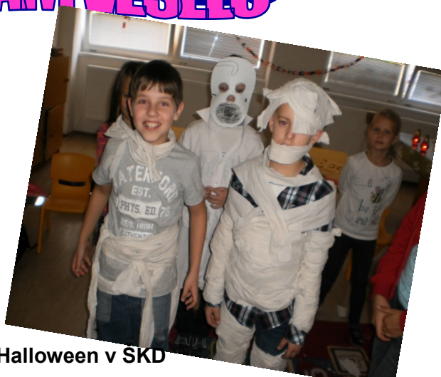
Halloween v SKD